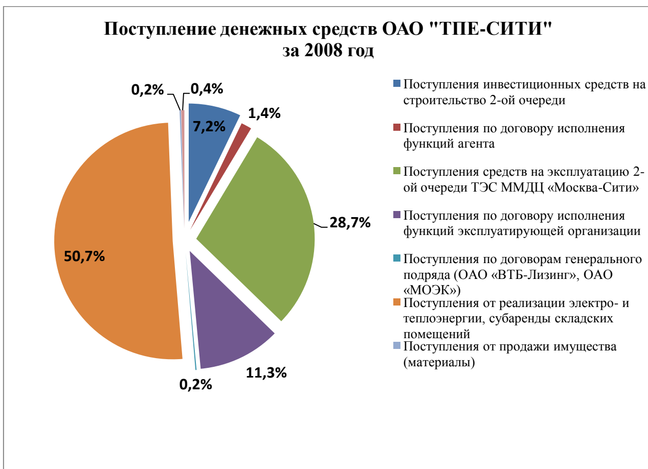
Диаграмма № 3

Из диаграммы № «Поступление денежных средств ОАО «ТПЕ-СИТИ» за 2008 год» видно, что основной объем поступлений составили доход от реализации электроэнергии и теплоэнергии, средства на строительство и эксплуатацию 2-ой очереди, средства на исполнение функций эксплуатирующей организации. При этом средства от реализации электроэнергии и теплоэнергии, а также от сдачи складских помещений в